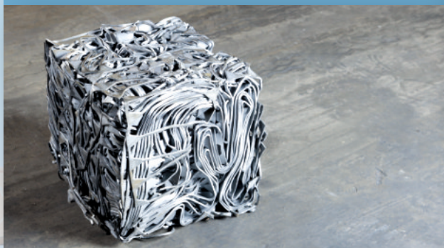
เศษเหล็กคัดคุณภาพอัดก้อนขนาด 30X30 Small sized bushelling bundle (30x30cm)